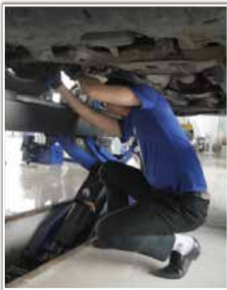
目前四轮定位普遍的操作场景