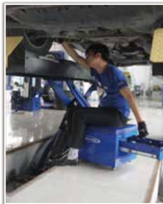
使用多功能工作凳搭配EVA工具托组套，不仅可以降低使用者的疲劳强度，还能减少来回选取工具的时间、提高工作效率